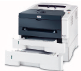
PF-100 Depósito de papel

El producto mostrado incluye elementos opcionales