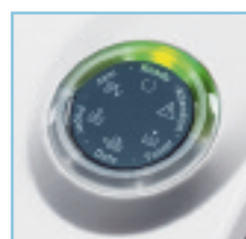
LED panel de control para un sencillo manejo

Una resolución de 1.200 ppp garantiza textos claros y gráficos nítidos